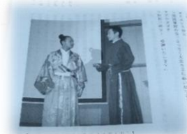
義鎮役とアルメイダ役 （『大友氏風景』(五)より）

この日は正にクリスマスでした。“戦国のメリークリスマス”でした。義鎮とアルメイダの間に、海を越え“永遠の友情”が結ばれた瞬間でもありました。