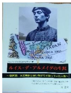
『ルイス・デ・アルメイダの生涯』 (著作 牧達夫氏)